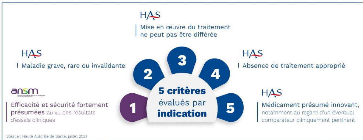
Figure B. Critères d'évaluation des demandes d'accès précoce

La procédure d'évaluation dure au maximum 3 mois. Si le médicament remplit l'ensemble de ces critères, les médicaments sont mis à disposition 2 mois après la décision 7 d'autorisation d'accès précoce. Les médicaments en accès précoce sont intégralement pris en charge sans avance de frais de la part des patients.